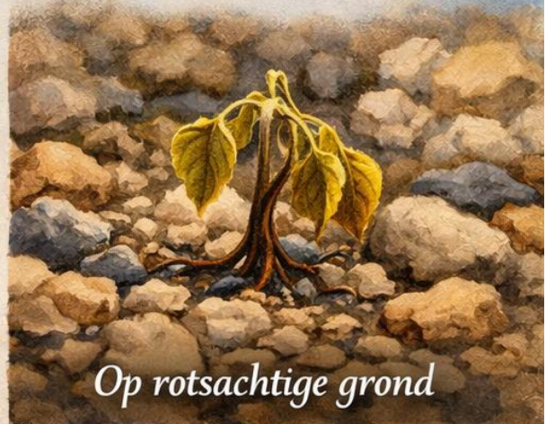
Op rotsachtige grond