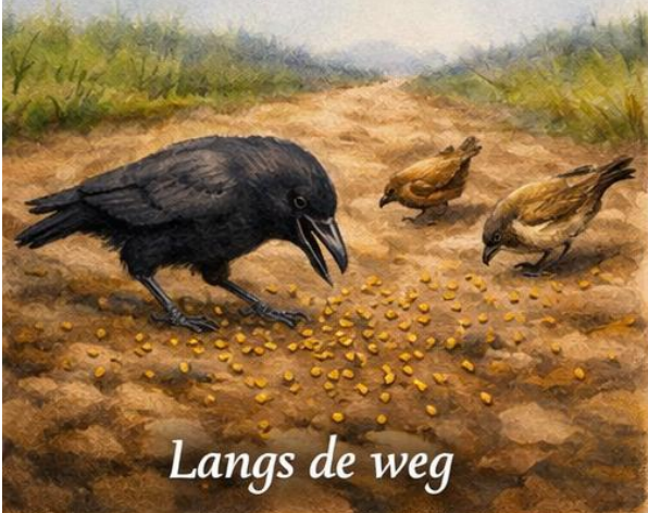
Langs de weg